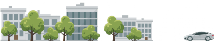
Grafik 2: Beispiel eines möglichen GAP-Schadens